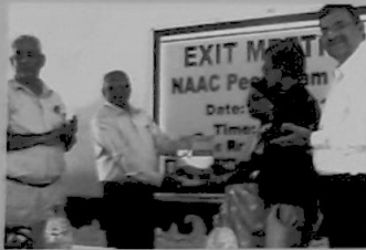
Handing over of report to Biswanath College by NAAC peer team