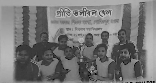
MEMBERS OF CHAMPION VOLLEY BALL TEAM OF L.O.K.D. COLLEGE