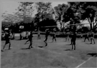
Snapshot of Teachers' Volleyball competition at Biswanath College, Sonitpur Zone