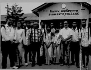
MoU Biswanath & Kaliabor College